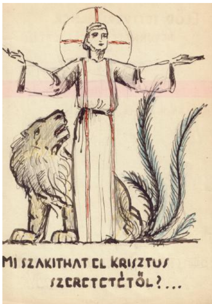
Szent. Primus vértanú Pannonhalma, 1954. jún. 9.